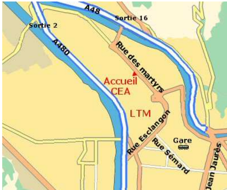
Plan du polygone scientifique